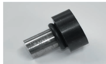
ステンレス×炭素鋼