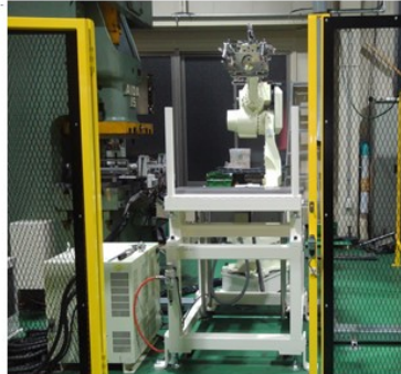
プレスローディング装置