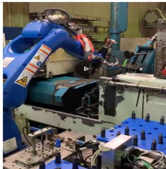
円筒研削盤ローディング装置