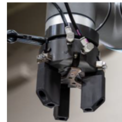
(サンプル:ロボットハンド)