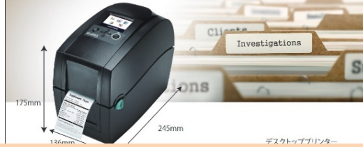
デスクトッププリンター