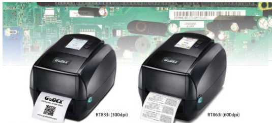
デスクトップラベルプリンター RT833i (300dpi) / RT863i (600dpi)