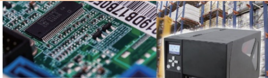
堅牢でコンパクトな高解像度プリンター BPZ436i (300dpi) / BPZ464i (600dpi)