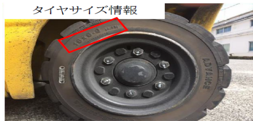
②交換したいタイヤの 写真をご用意ください