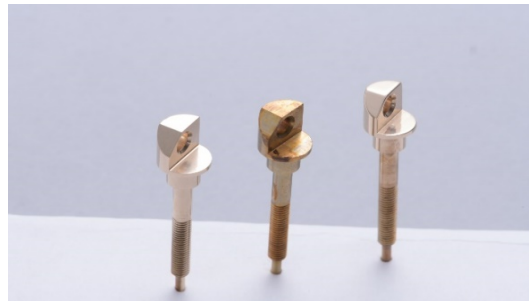
小さく複雑な形状の製品にも可能な鏡面仕上げ