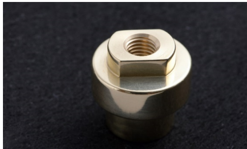
小物の各種金属製品も対応