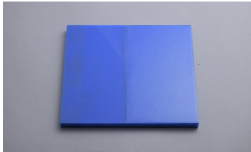
金型によって樹脂製品に発生するウエルド、 パーティングラインのバフ研磨による修正