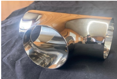
サニタリー配管などの表裏両面の鏡面仕上げ