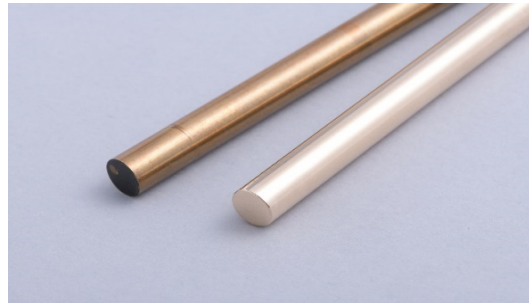
多種多様なサイズの製品にも対応